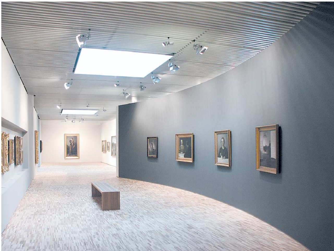
Taidegalleria Aros/Tanska, PR-U säle, valkoinen Århus Art Museum Aros/Danmark, PR-U Profile, white