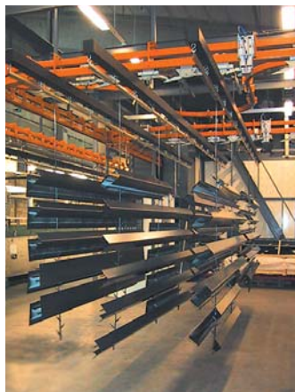
Viimeisin tuotantoteknologia Production technology

As a manufacturer of fittings for interiors, our coatings must be of the highest quality. Powder coating is therefore a vital element of our production. We deliver around 400 different shades and surface textures, including genuine wooden coatings, to our clients each year. We work with all known colour systems and gloss levels.