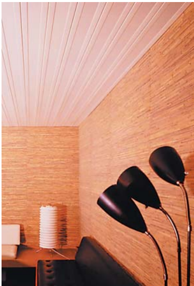
KF-100 paneeli, oleskelutila KF-Panel, lounge