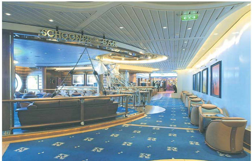
Freedom of the Seas / Schooner Bar / UPCRT-150 paneeli, maalattu/UPCRT-150 Panel, painted