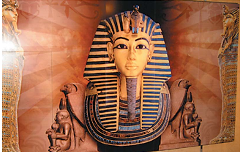
Kasettitaulukokonaisuus useasta eri kasetista Cassette ceiling unit comprising several individual cassettes