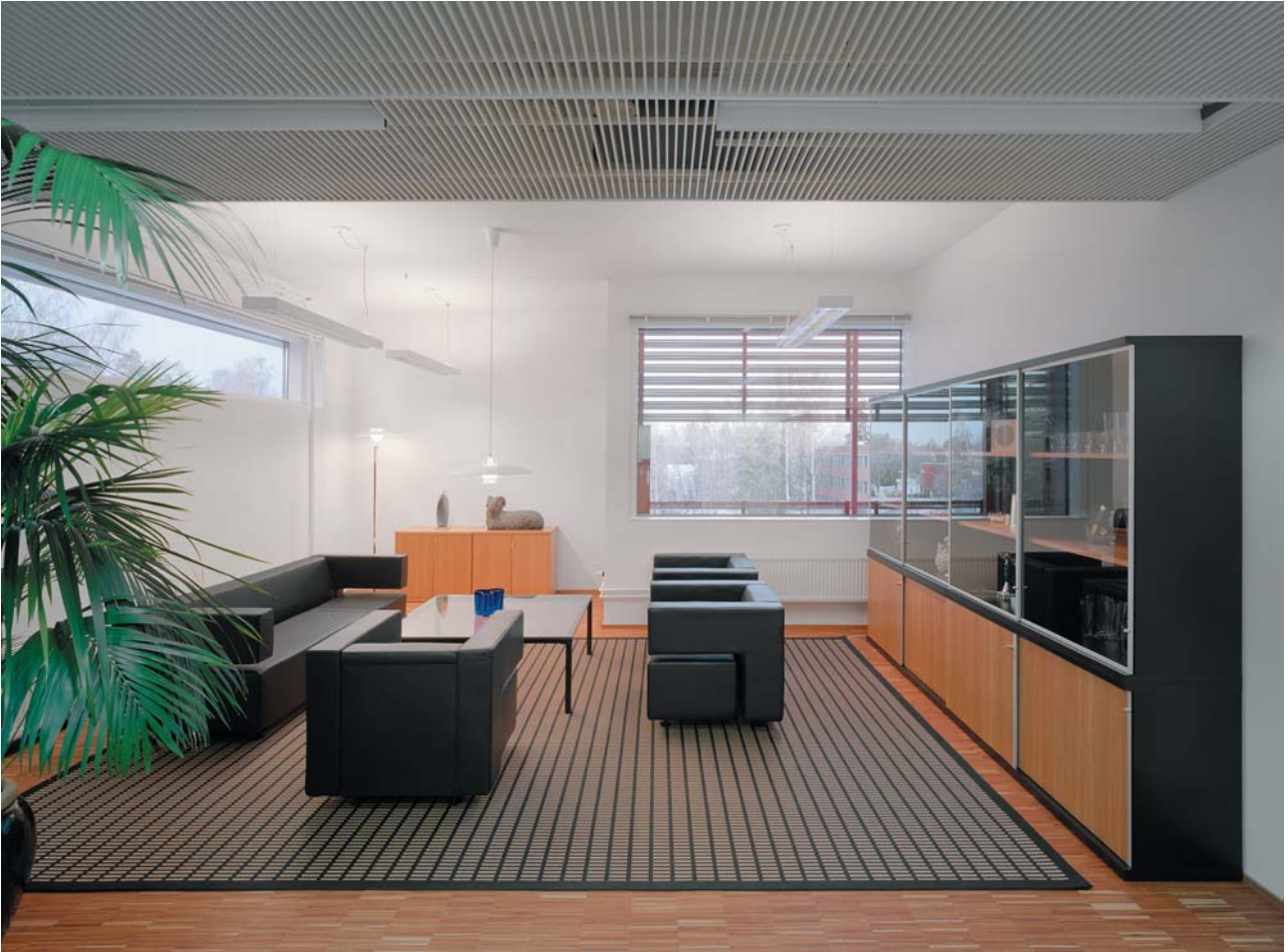
Toimistotalo Digitalo / erikois WS-ritilä, helmenvalkoa Office House Digitalo, Special WS Grating, pearl white