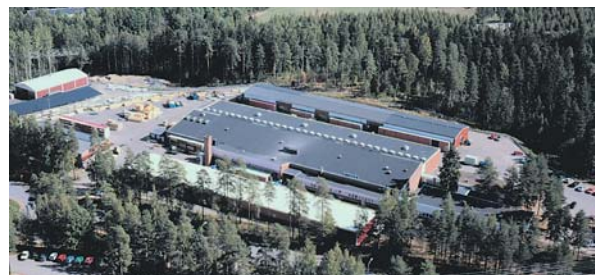
Lautex tehdas, Lautex factory

Lautex has boosted its recognition in the shipbuilding and construction industries both in Finland and internationally in recent decades. Today we are a global supplier of metal ceilings.